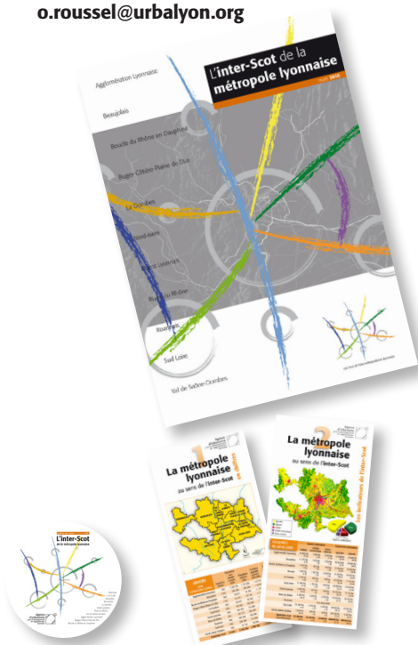
Le « kit de communication » de l'inter-Scot

Le bureau du 25 février 2009, en application de la loi de modernisation de l'économie, a décidé l'élaboration d'un schéma d'aménagement commercial. Adopté à la majorité le 25