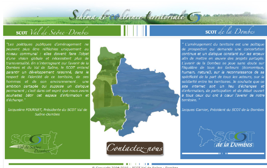
La page d'accueil du site partenarial dombiste.